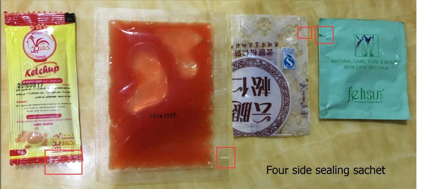
Four side sealing sachet