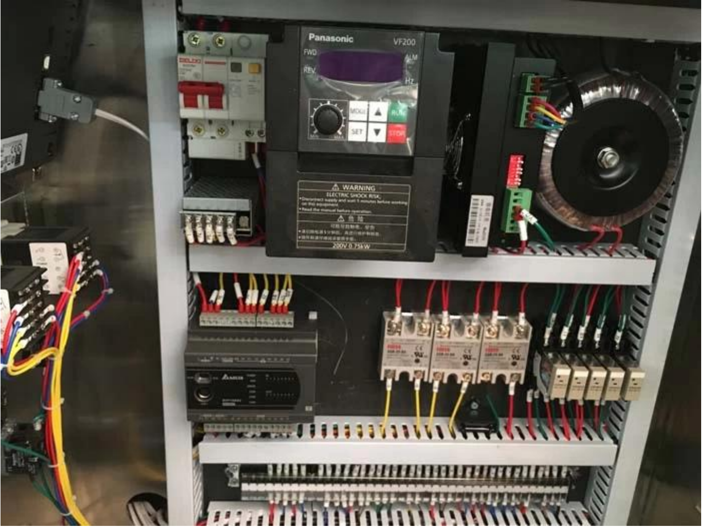
HAZNELİ VE TOZ OLMAYAN AKRİLİK KAPAKLI TAM PASLANMAZ ÇELİK 304# BARDAK ÖLÇÜM SİSTEMİ.