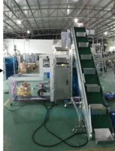
2. Material goes up by the chain