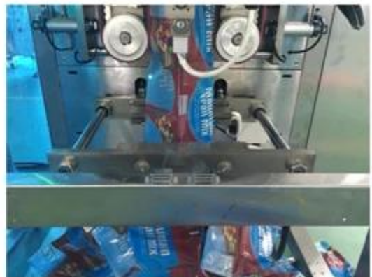
6. Bag Making