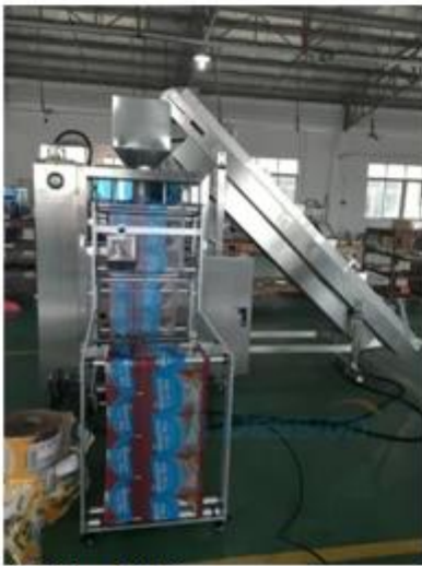
4. Film Pulling