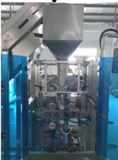
5. Material on Container