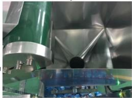
3. Material goes into the Container