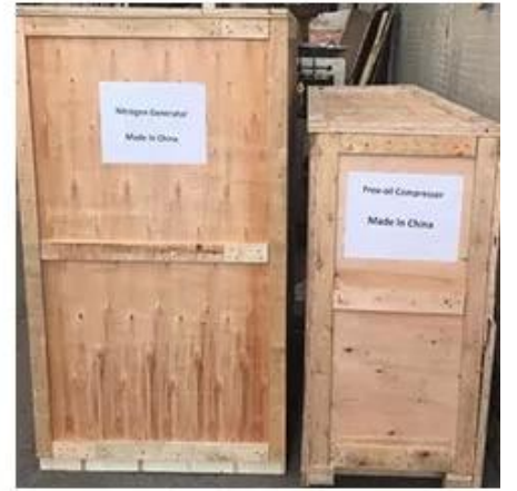
Wooden Box Packing