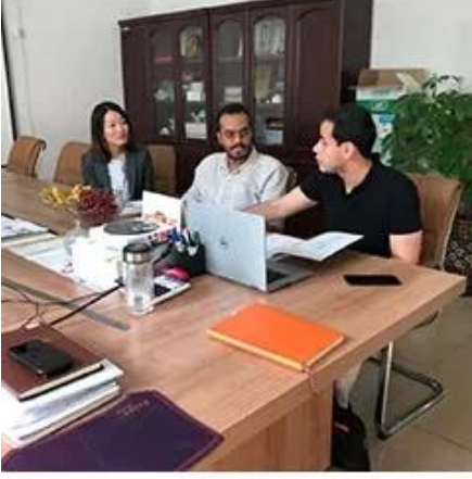
Collect Customer Needs