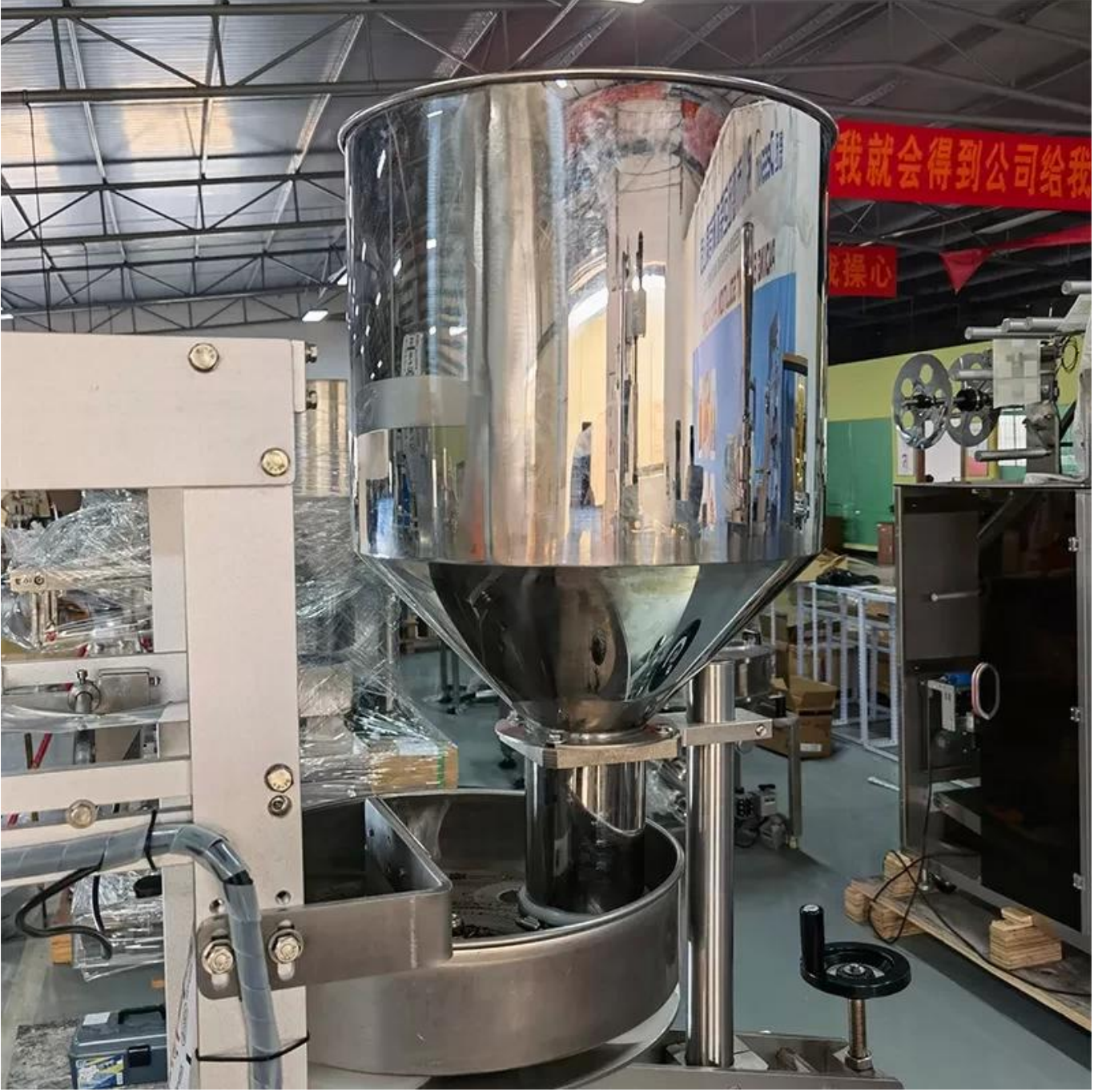
Hazne ve ölçüm kabı