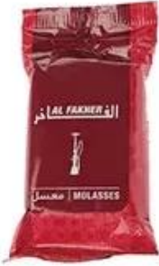
Plastic Bag Packing