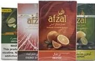
Cellophane & Tear Line Wrap