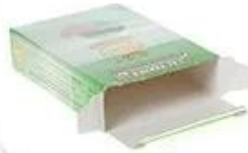
Bag Into Box