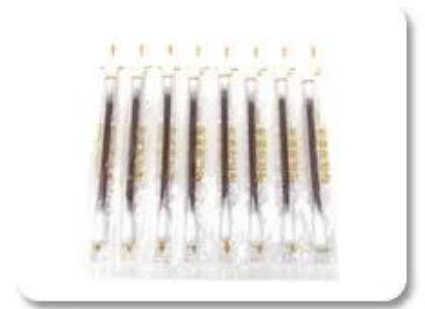
Sterile Cotton Swab