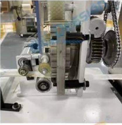
Toothpick precision positioning device