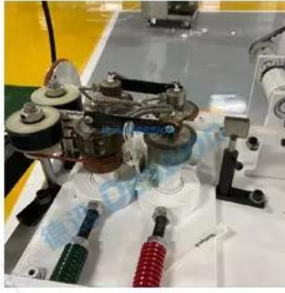
Bag sealing device