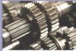
High quality material