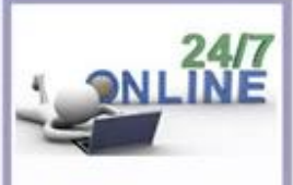
7-24 Hours services