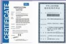
Tight quality control