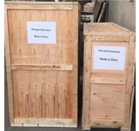
Wooden Box Packing