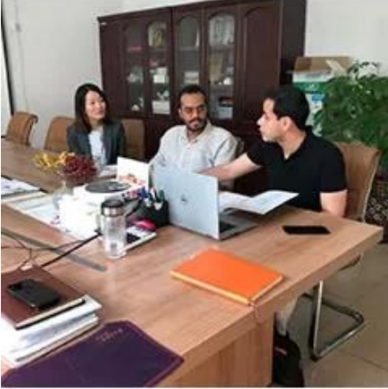
Collect Customer Needs

Müşterilerin makinenin kullanımı sırasında herhangi bir sorusu olursa, zamanında cevaplayacağız.