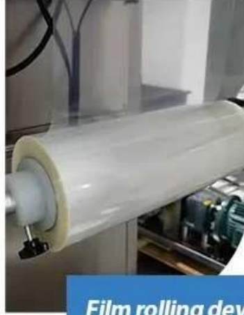
Film rolling device