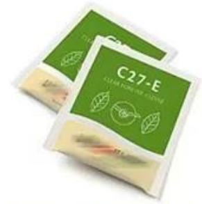
Inner and outer bag Square/Pillow tea bag