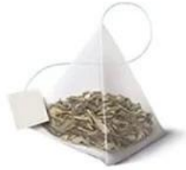
Triangle inner and outer bag