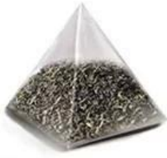
Nylon triangle tea bag