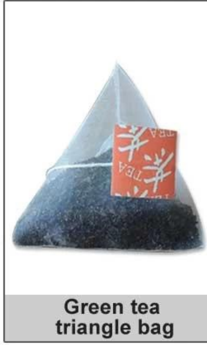
Green tea triangle bag