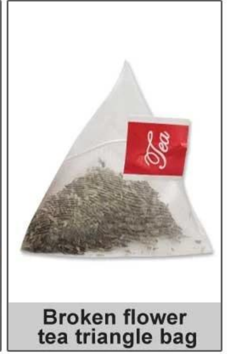
Broken flower tea triangle bag