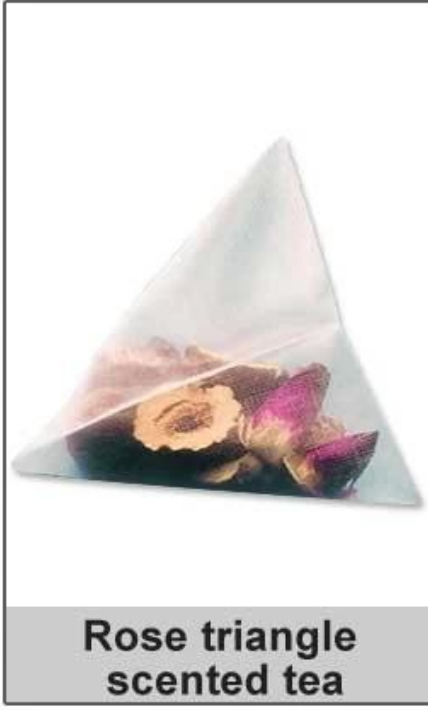
Rose triangle scented tea