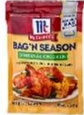
3/4 side seal bag