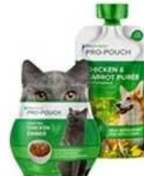
Special shaped bag