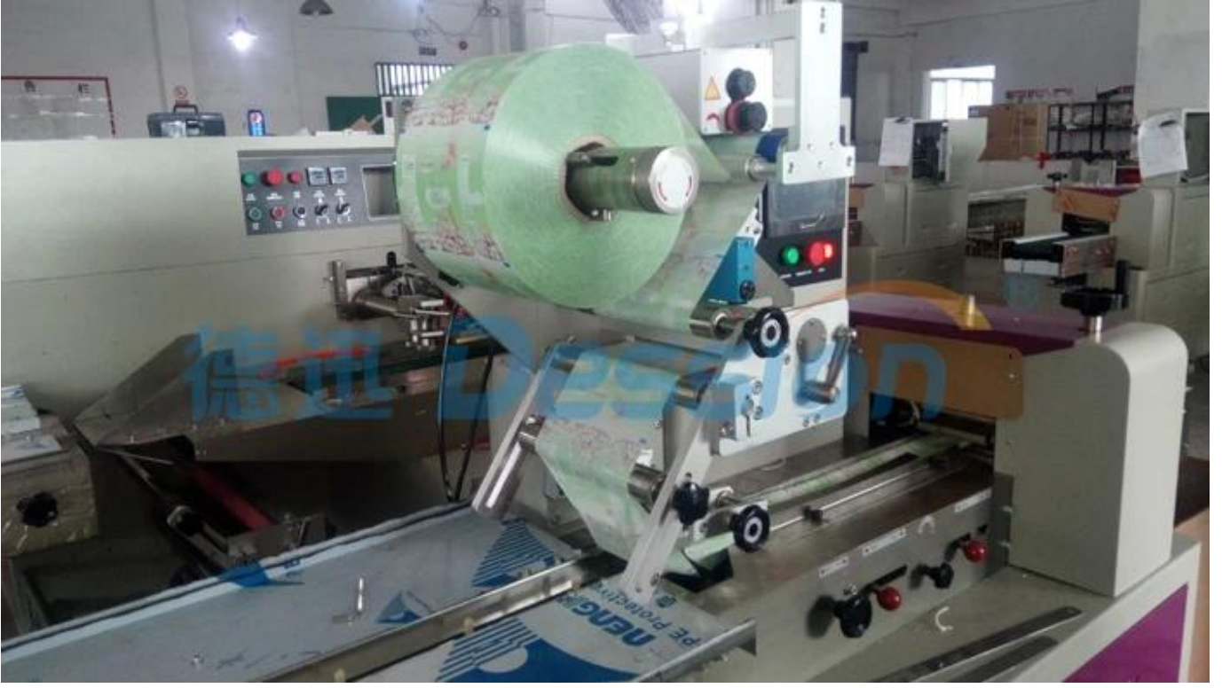
Film Çekme 1