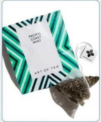
Tea Bag With Envelop