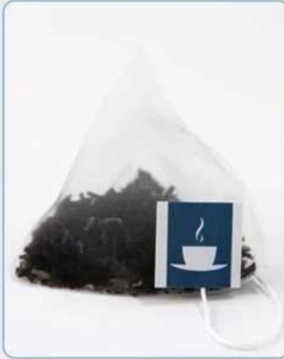
Pyramid Tea Bag