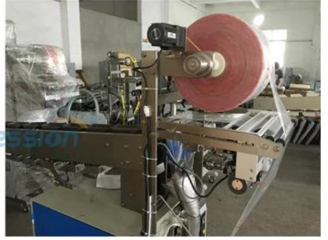
320E DETAIL PHOTOS