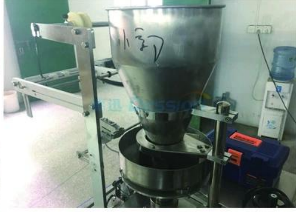
POWDER PUT IN EQUIPMENT