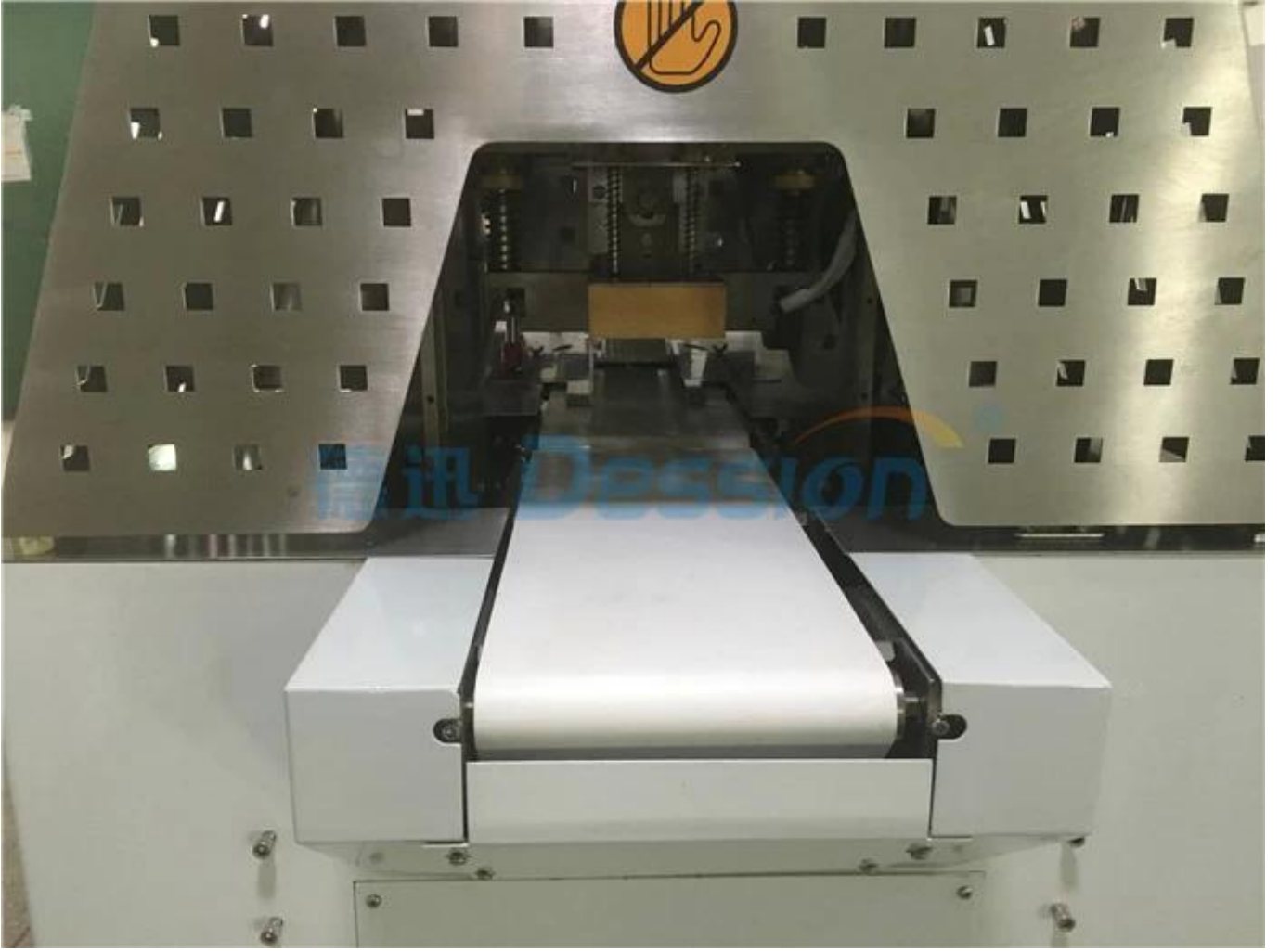
Kesme Bıçağı ve Bitmiş Ürün Konveyörü