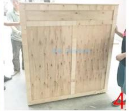
Ovma Pedi akış paketi makinesi ve CE onaylı paketleme dolum makinesi