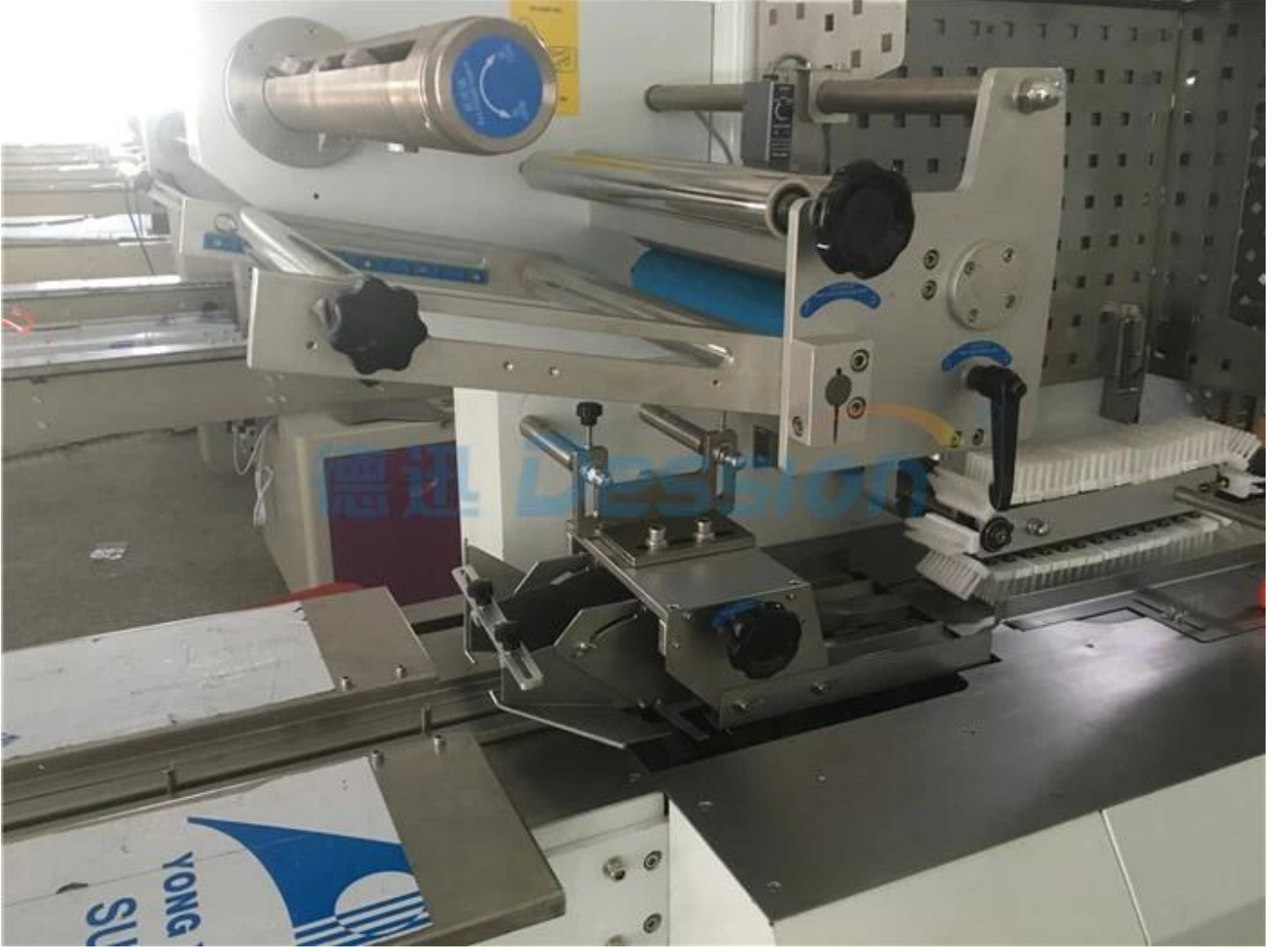
Tarih Kodu Yazıcısı & Film Şekillendirme