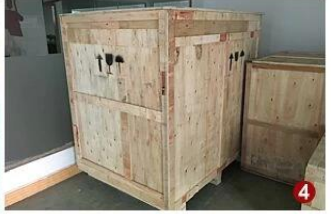
Küçük plastik tüpler çantası ambalaj Dolum Makinası otomatik çok kafalı Tartım