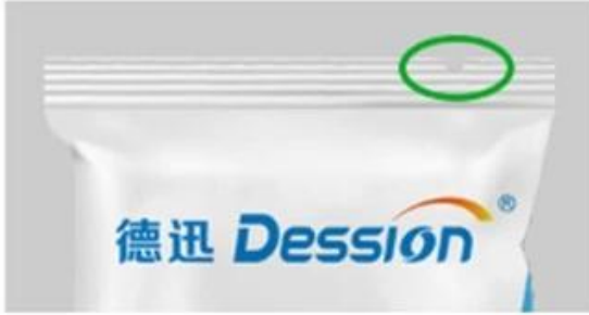
Bag With Easy To Tear