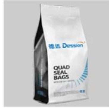
Quad Seal Bag