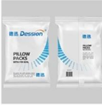
Back Seal Bag