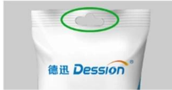
Bag With Hole