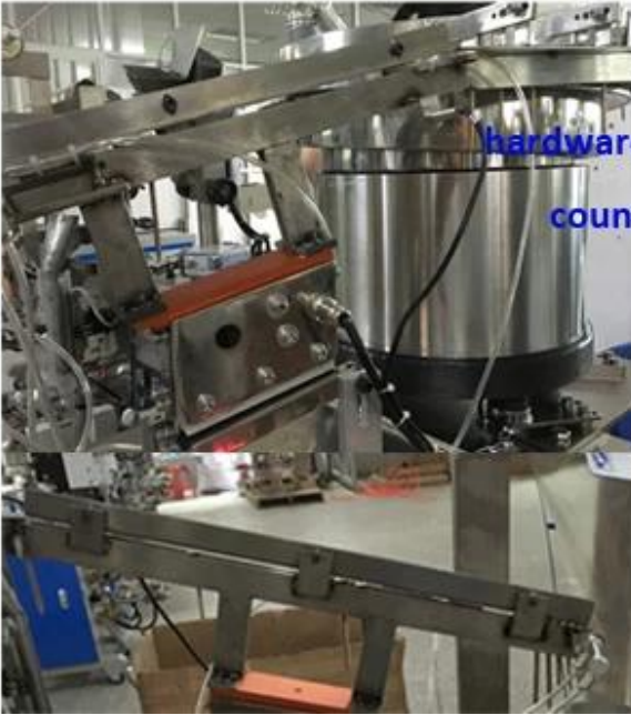
hardware screws/nuts/bolts nails/fastener, counting package solution