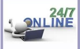
7-24 Hours services