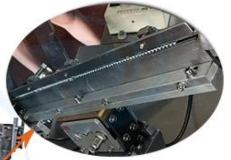
Precise Skid Trail