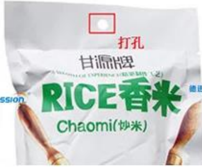
Round Punching Hole