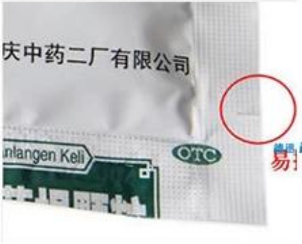
Easy Tearable device