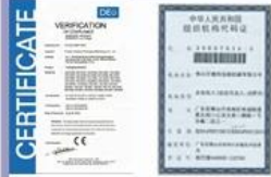
Tight quality control