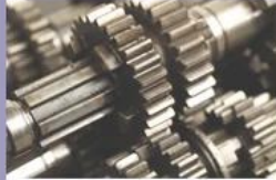
High quality material