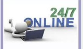
7-24 Hours services