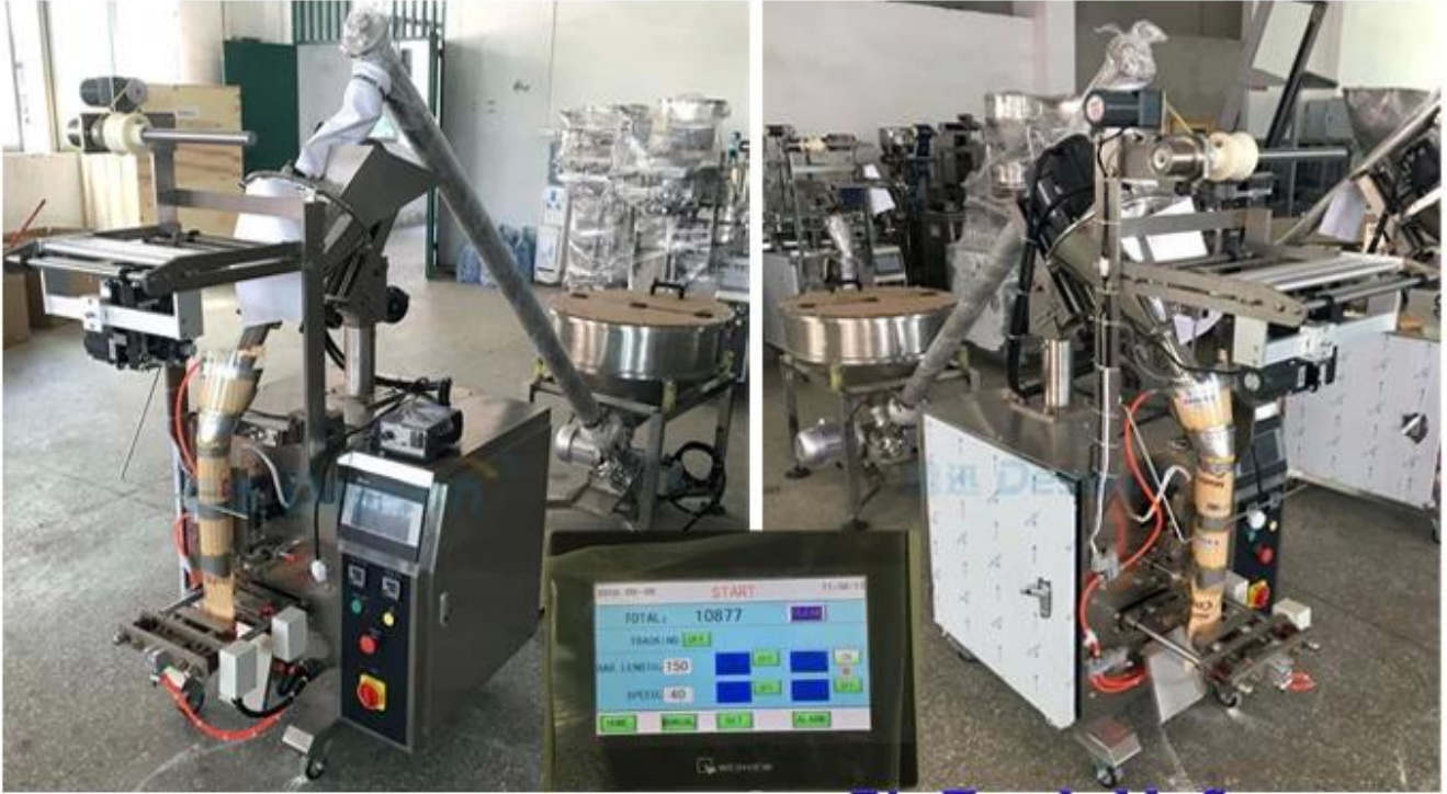
Big Touchable Screen

süper dokunmatik ekran, özelleştirilmiş 50L/70L depolama hunisi, vida ölçüm cihazları