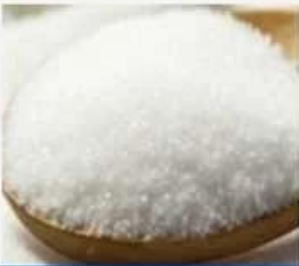
refined cane sugar