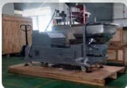
Wapping the Machine