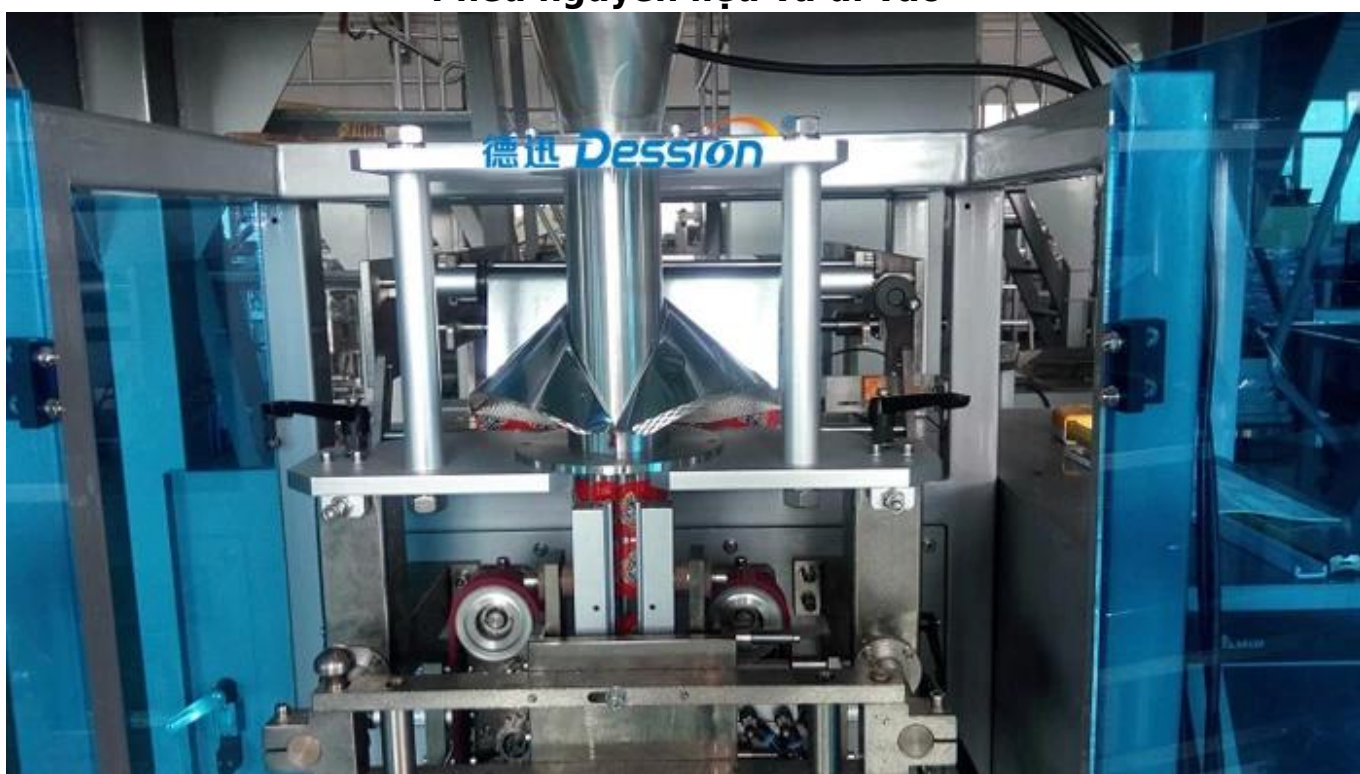
Túi hình thành