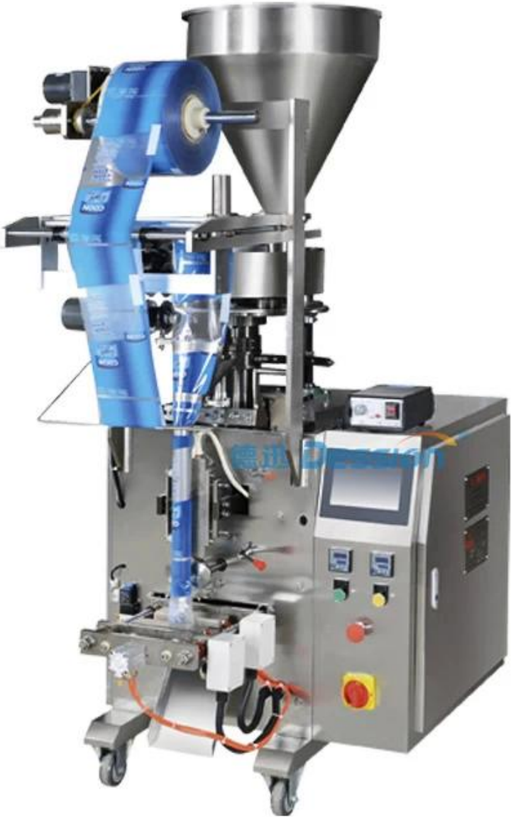
hình ảnh chi tiết