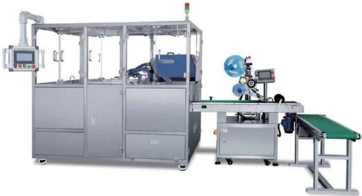
Hình ảnh chi tiết