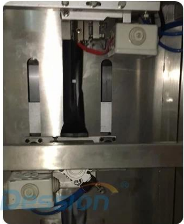
bag forming and sealing