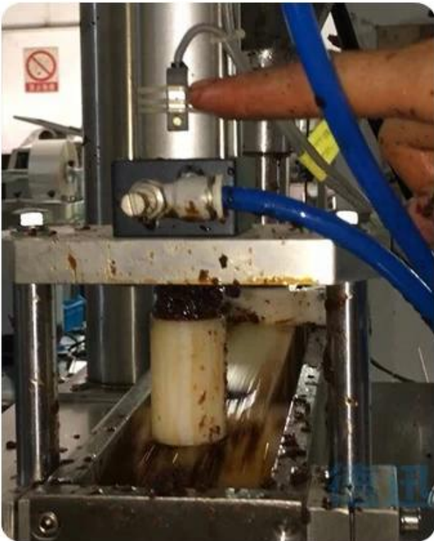
hookah measuring and filling