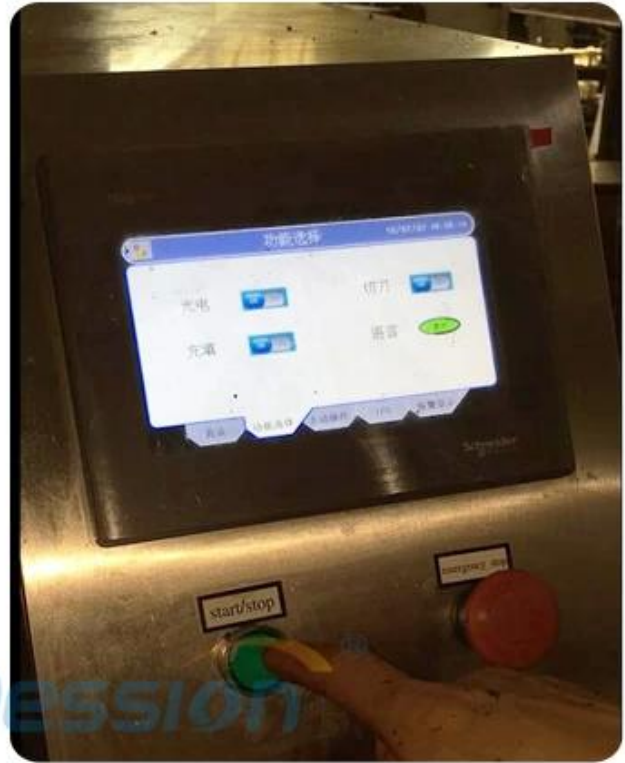
press start button