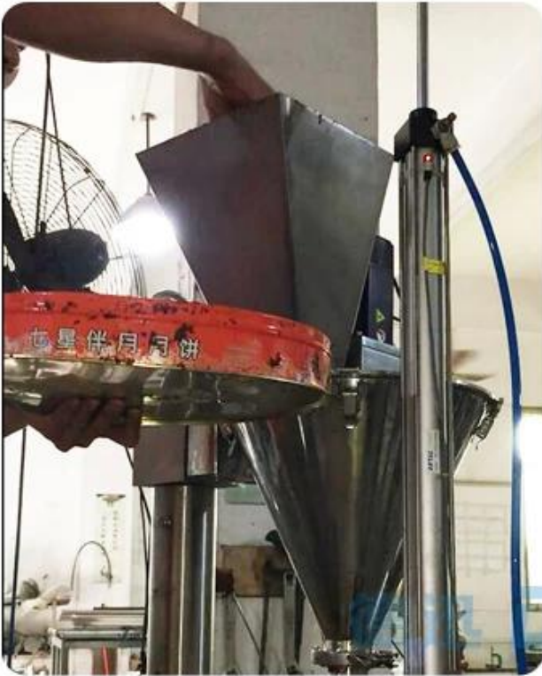
feed hookah into hopper