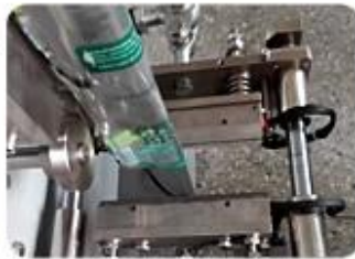
Three Side Sealing Mold