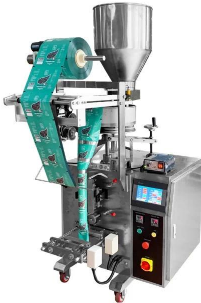
hình ảnh chi tiết