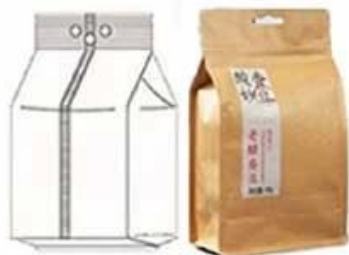
Bag with hole punching