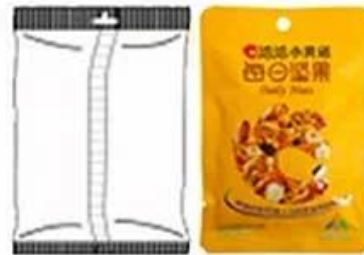
Bag with euro hole