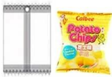
Bag with round hole