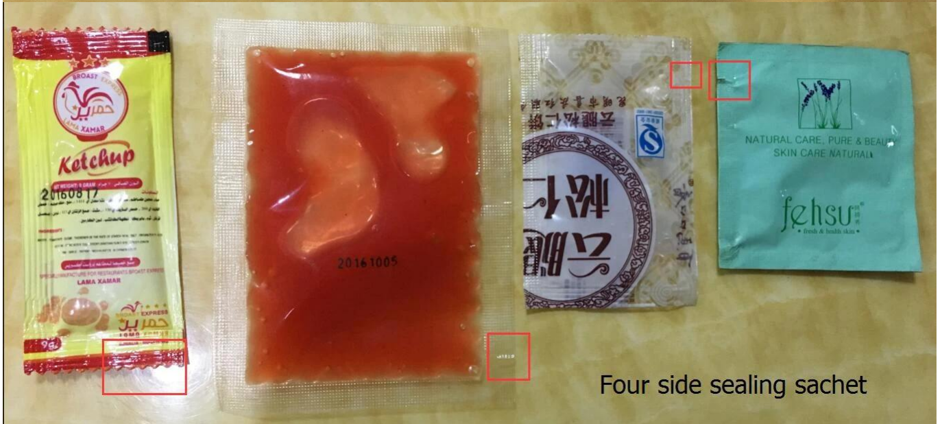
Four side sealing sachet