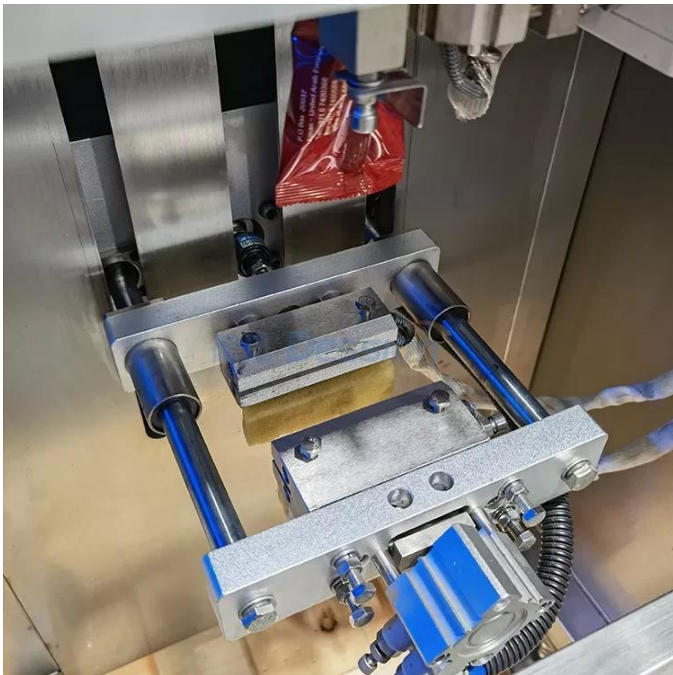
thiết bị cắt