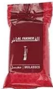
Plastic Bag Packing