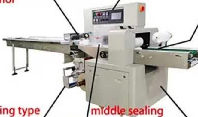
under film loading type