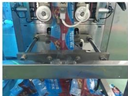
6. Bag Making