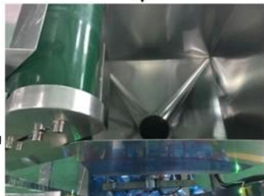
3. Material goes into the Container