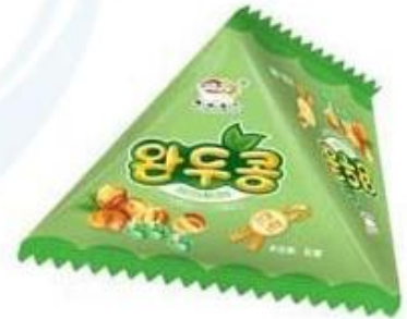
Candy / Nuts / Milk Bean