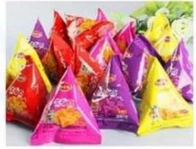
Puffed Food / Snacks / Dried Fruit