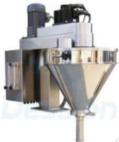
Bộ phận điện