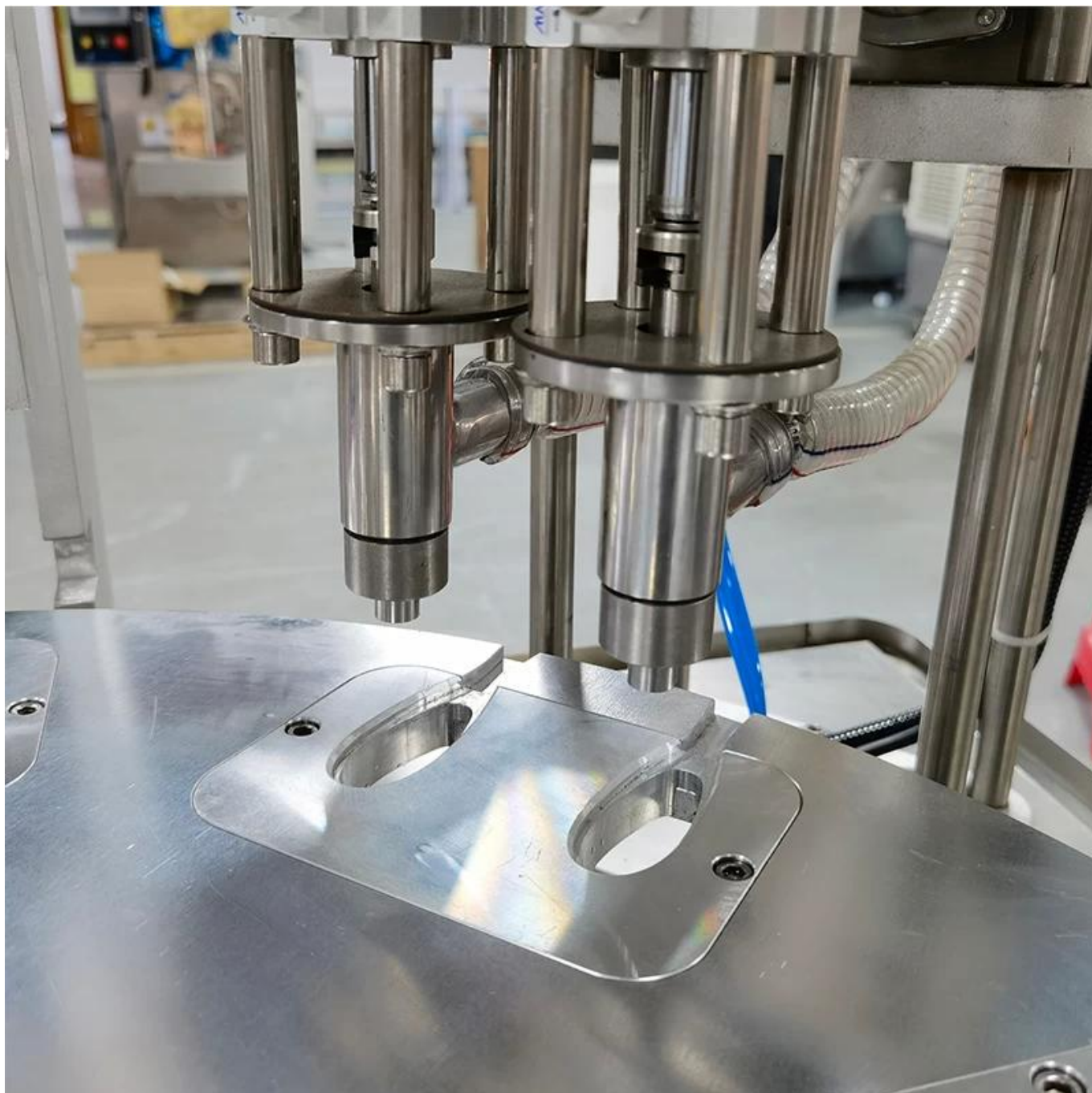
Làm dây mật ong