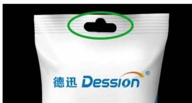
Bag with hole