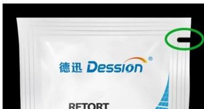
Bag with easy to tear