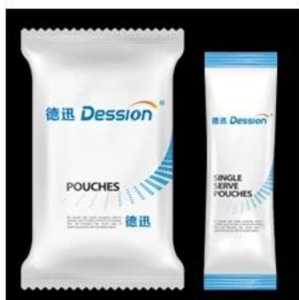
Back Sealing Bag