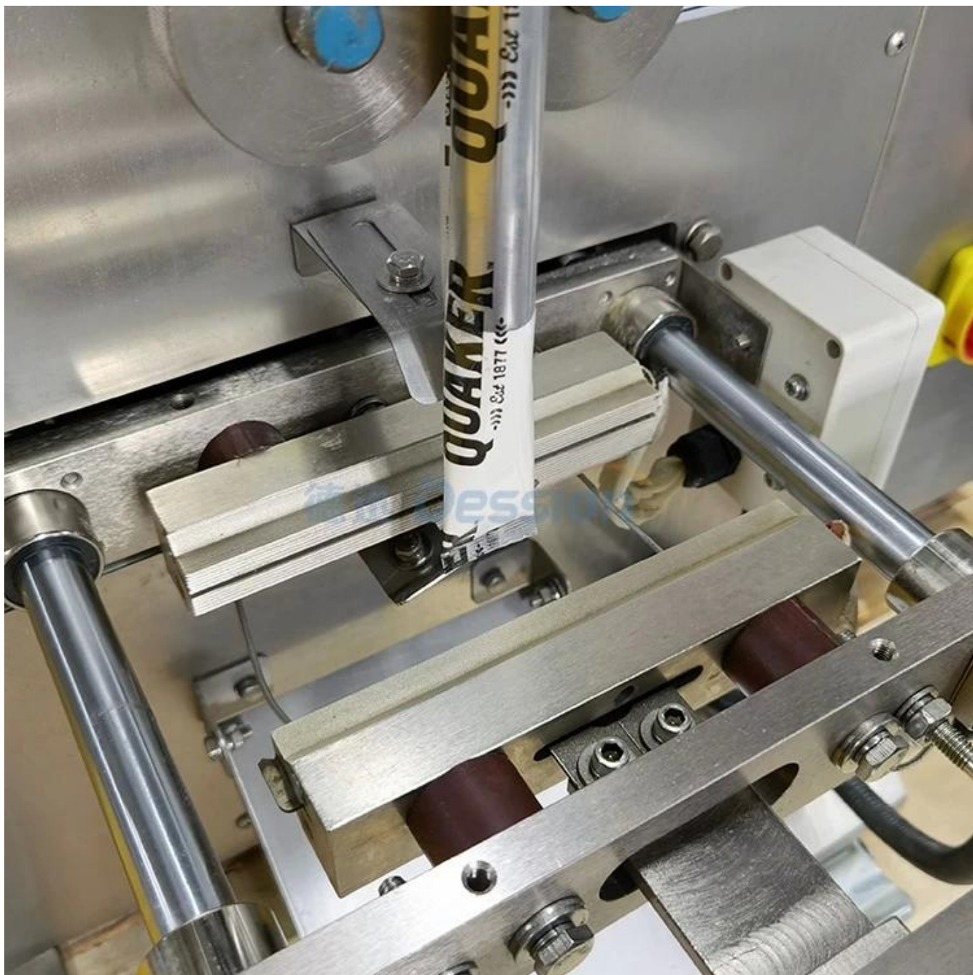
thiết bị cắt túi