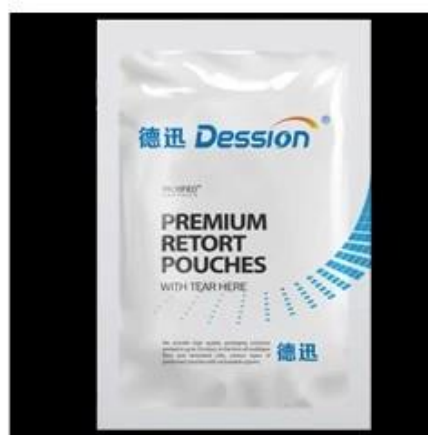
4-Sides Sealing Bag