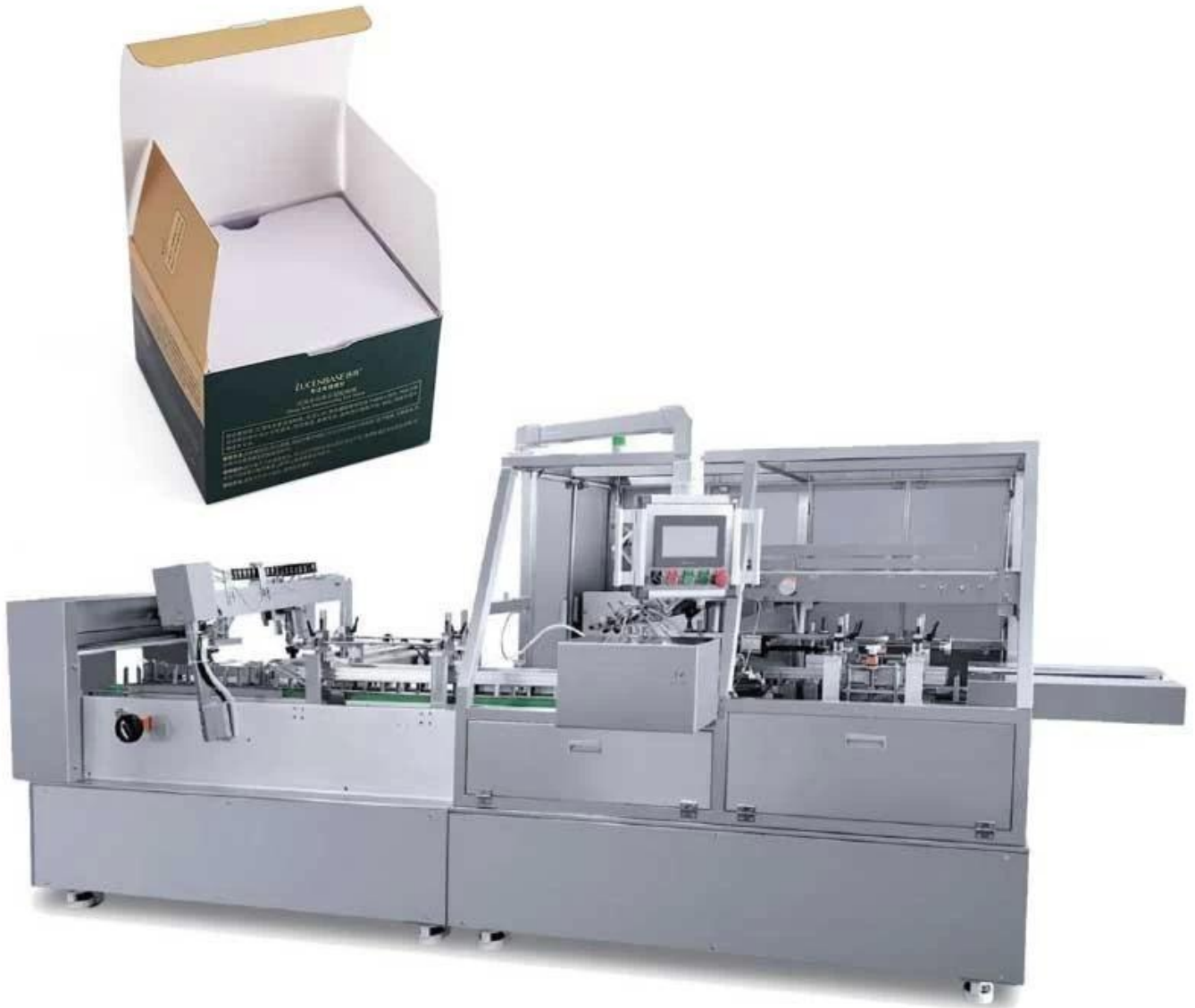
Hình ảnh chi tiết