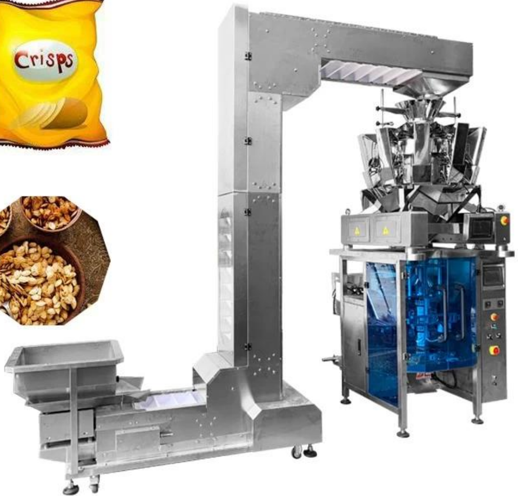
Hình ảnh chi tiết