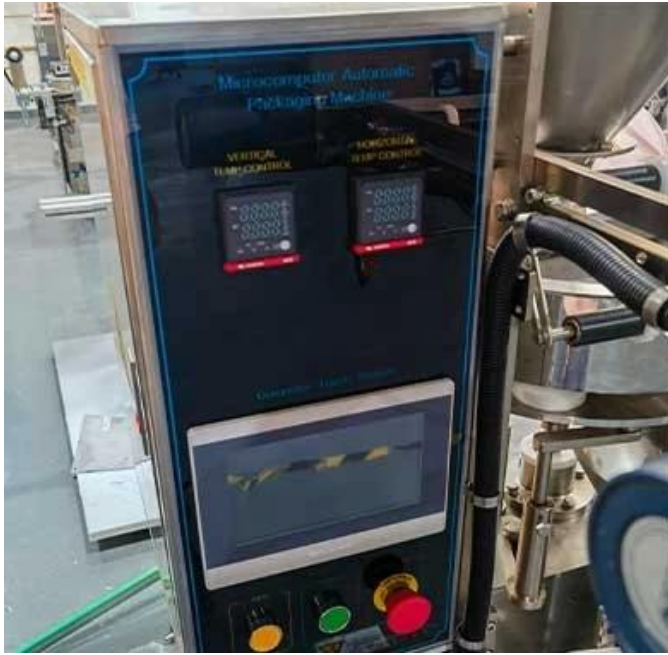
Màn hình cảm ứng thông minh