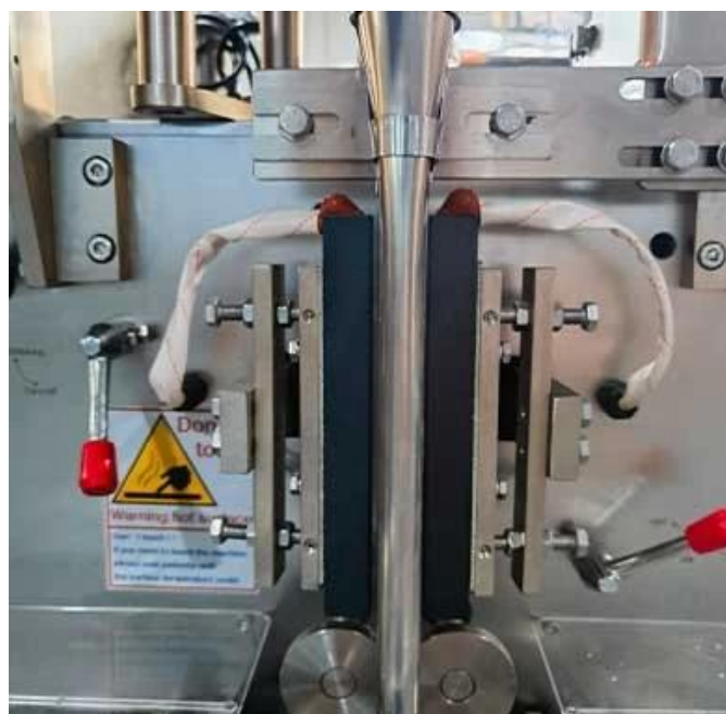
Thiết bị niêm phong túi