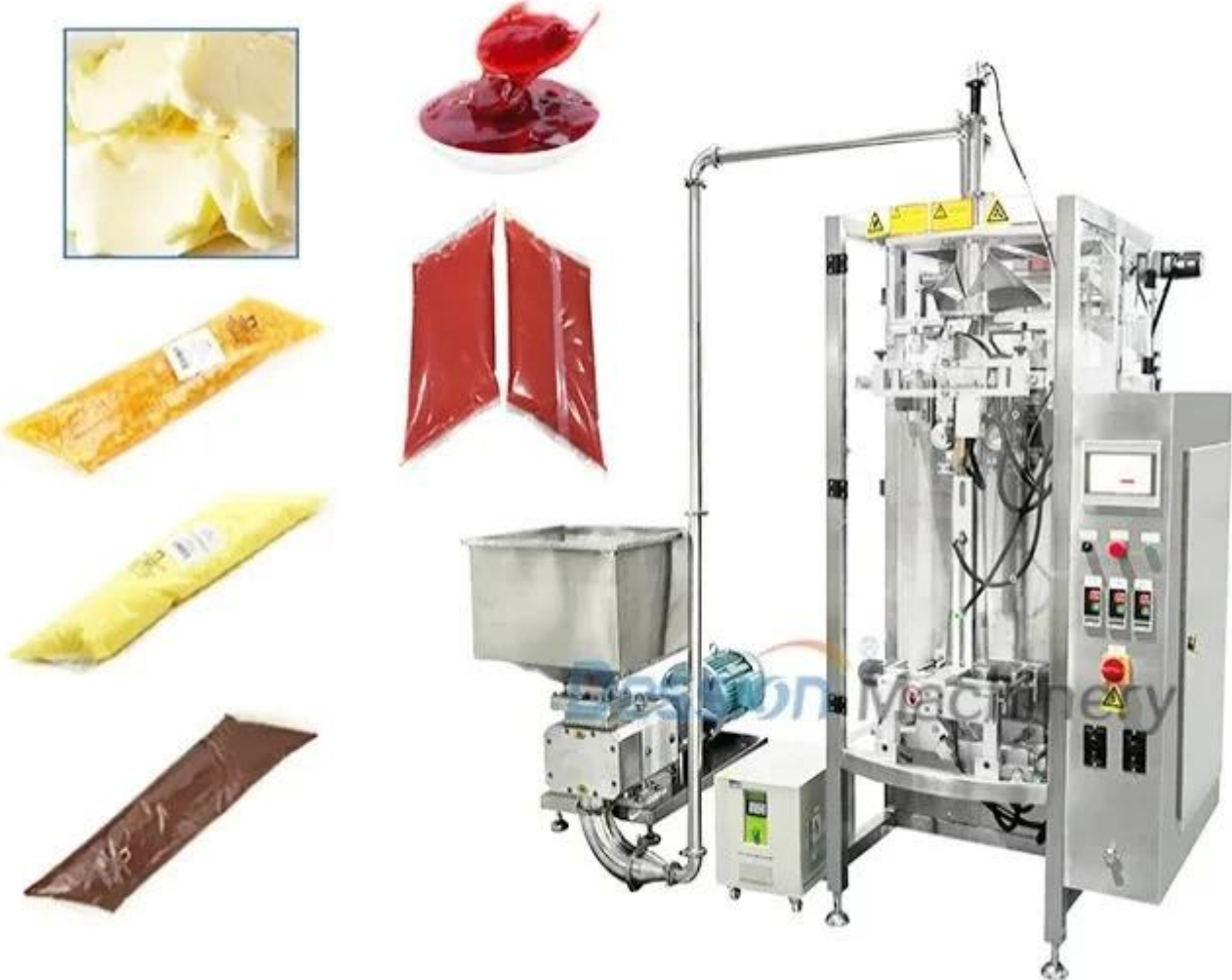
hình ảnh chi tiết