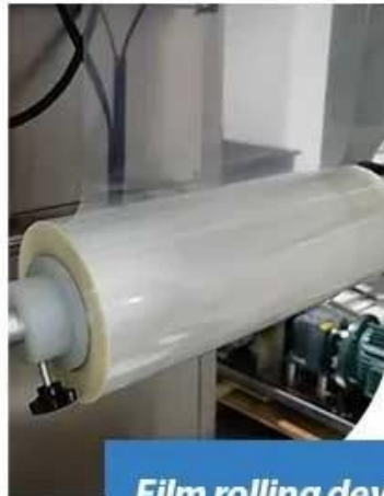
Film rolling device