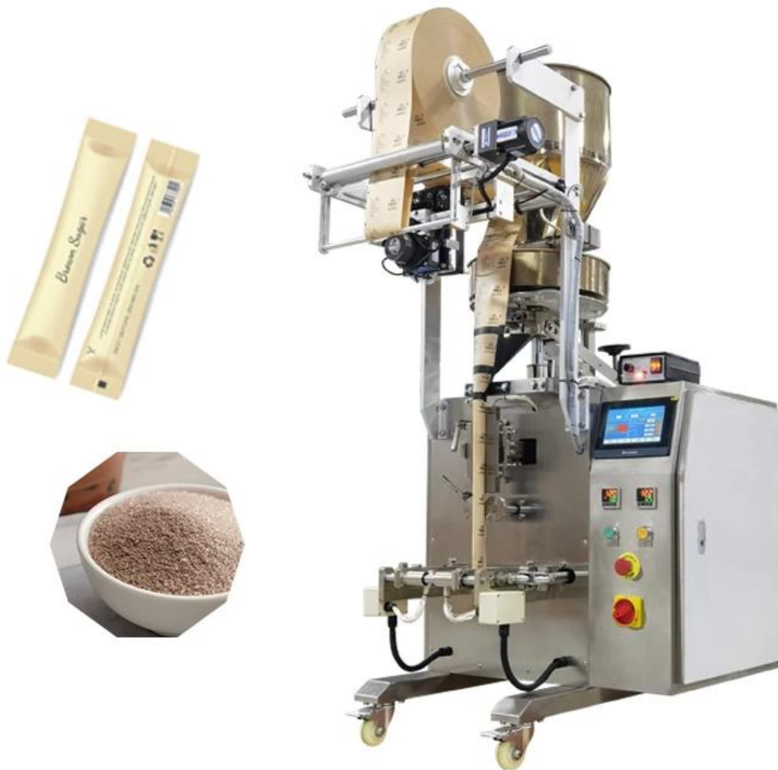
hình ảnh chi tiết