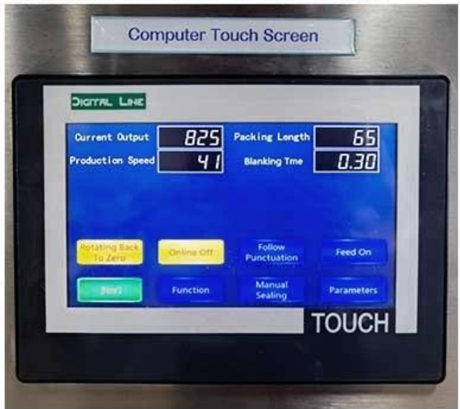
Simple operation of Chinese and English settings