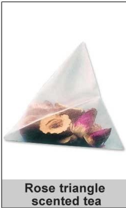
Rose triangle scented tea