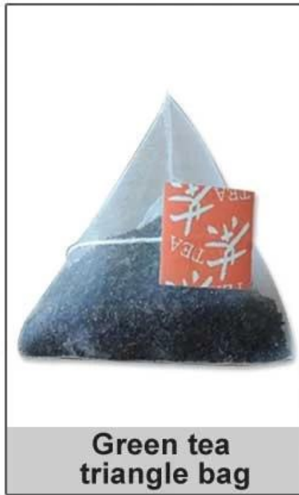
Green tea triangle bag