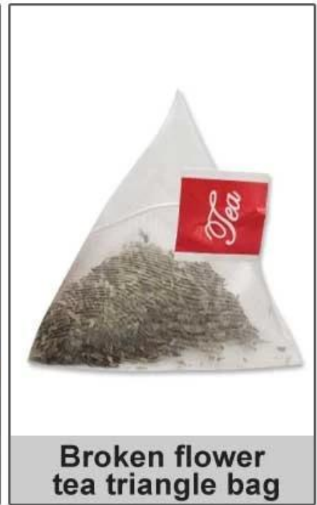
Broken flower tea triangle bag