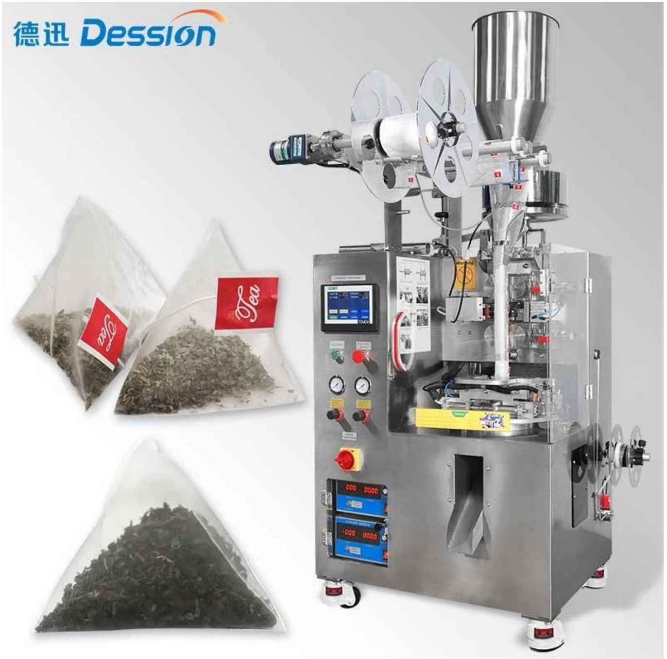
hình ảnh chi tiết