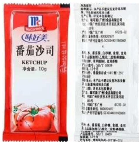
Hình ảnh chi tiết