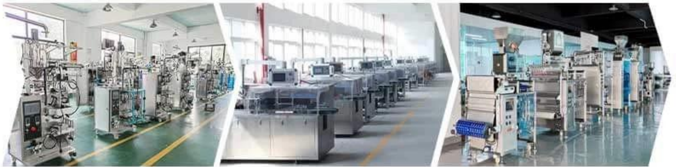
SMALL VERTICAL WORKSHOP