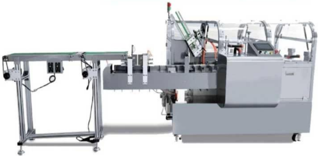
Hình ảnh chi tiết