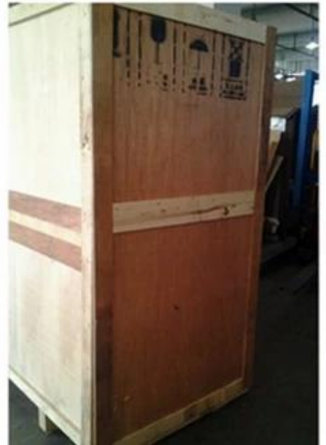
Máy đóng gói trà Weed In Sachets